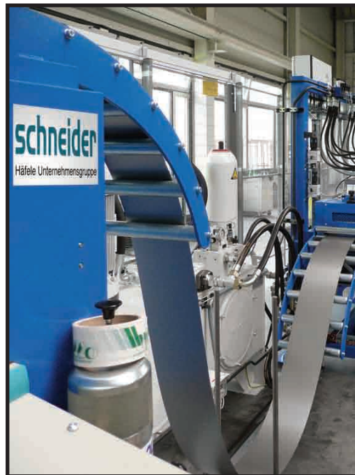
Linea de producción de los laterales Moovit en Alemania