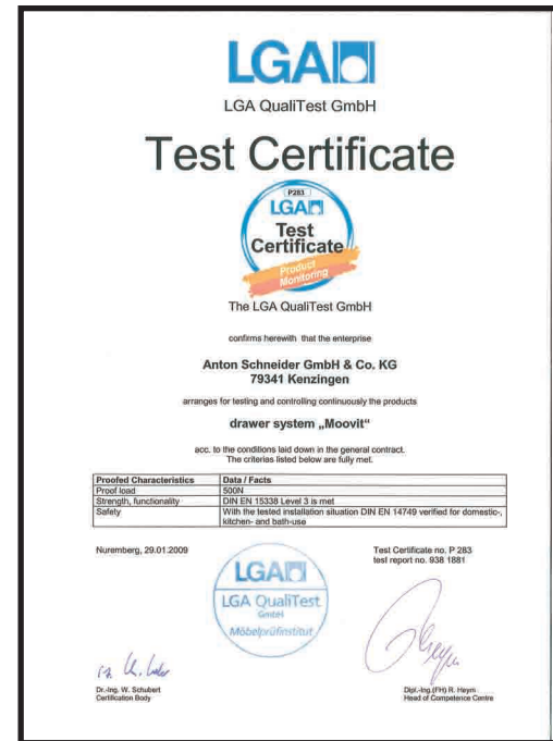
Los productos Moovit cumplen las normas de calidad más exigente. Estos productos tienen el certificado de calidad LGA