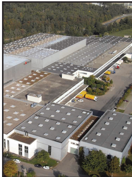
Fabricación de todos los productos Moovit en la fabrica de Kenzingen/ Alemania